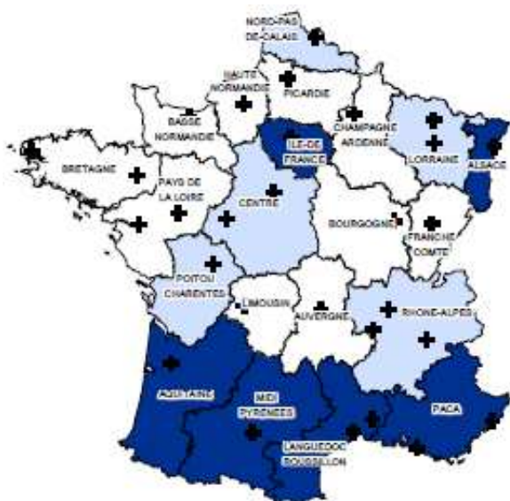
Densité des médecins spécialistes en radiodiagnostic et imagerie médicale (par région)